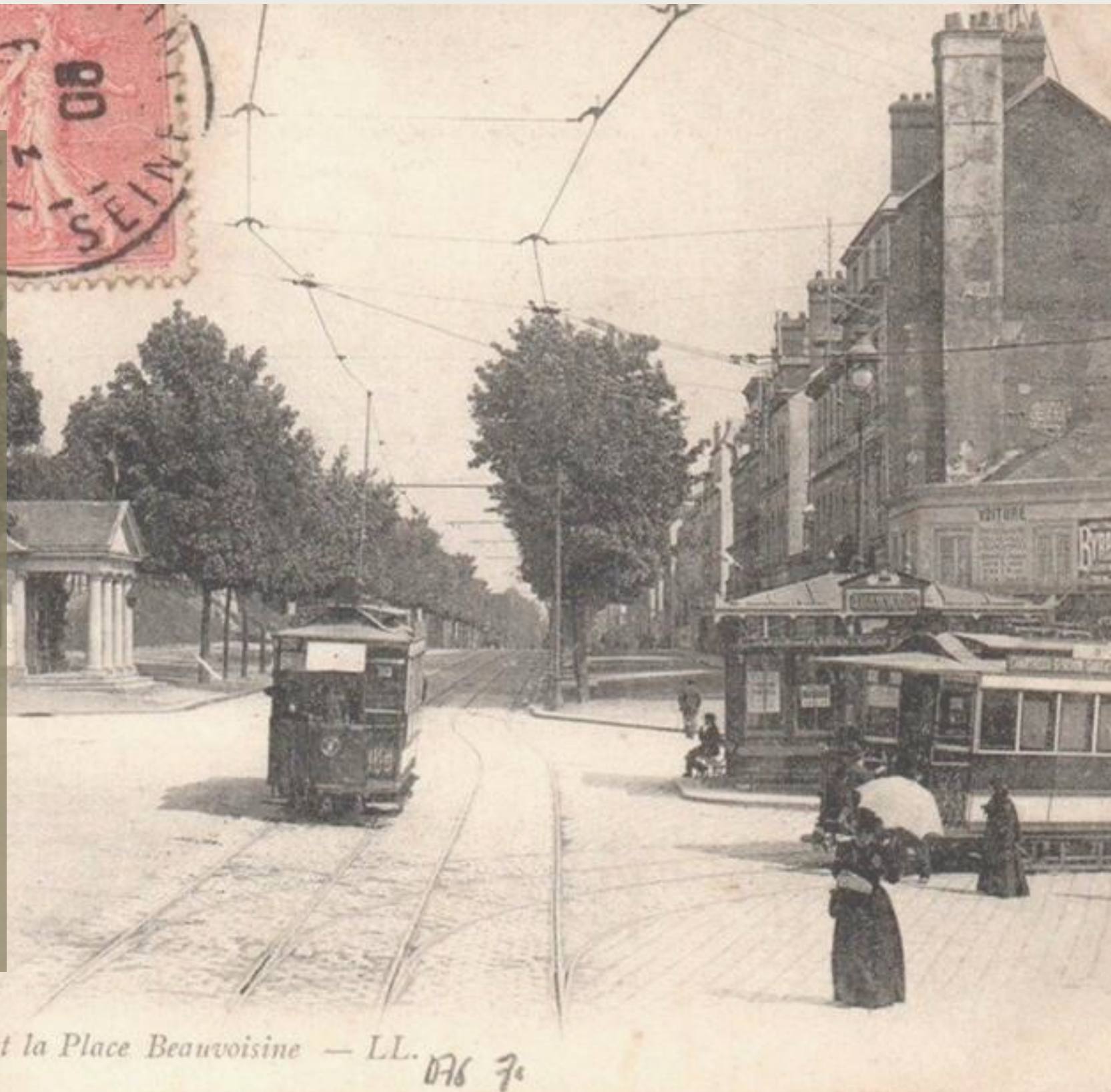
271 ROUEN. — Le Boulevard et la Place Beauvoisine — LL. 076 7c